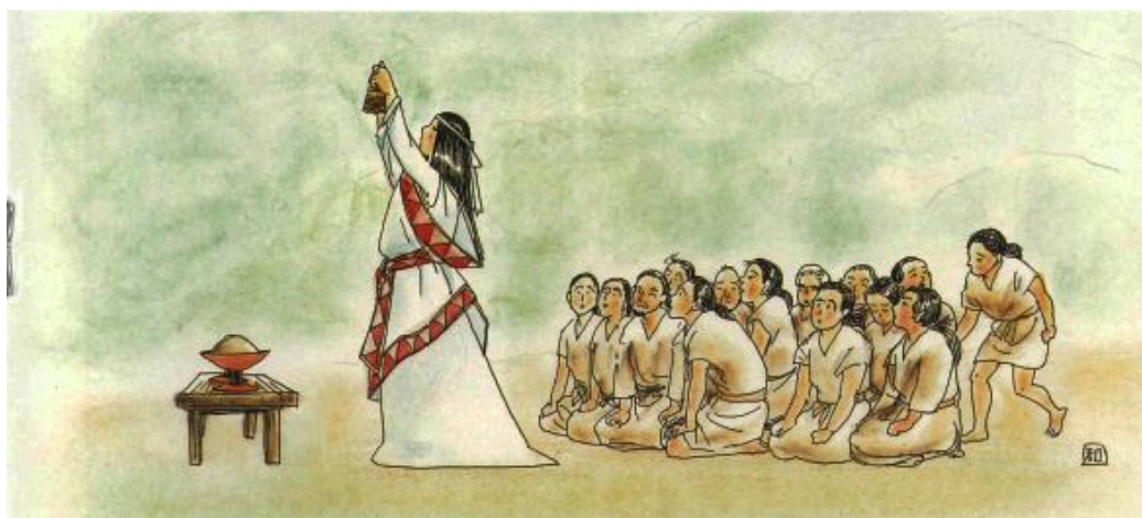
マツリで銅鐸を鳴らす巫女