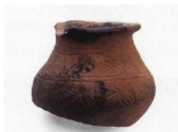
渋を入れていた小壺