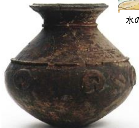
マツリで使われた赤彩の土器