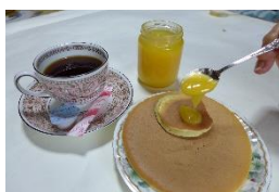
レモンスプレッド "spread" 塗り広げる意味