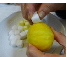
角砂糖を一つずつ持って角でレモンの黄色い色と香りをしみこませる。