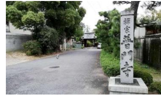
正面は普門寺の山門 左が旧富田小学校の正門 右が三輪神社境内