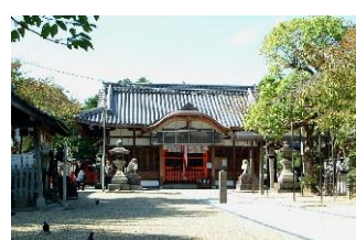
三輪神社は、富田の講の方と「けさんと会」で年中行事を行っておられます

地域の神社として幾先々までも存続し発展を願うものであります。神社の年中行事で関係者の高齢化により、いろんな祭りごとに支障が出るのではないかと危惧しております。