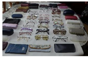
6月発送 リサイクルメガネ

創設時からの活動を見る事が出来ます。昨年5月8日から新型コロナウイルス感染症「5類感染症」になりましたが、感染しますと40℃近い高熱になり、非常に危険な病気であることには変わりなく、いつも最善の策をとりながら活動して来ました。