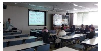
ゴミ問題のまとめ ○ごみ減量とリサイクル ○出来る事から始める

テレビニュースでも、最近特に世界のあちこちで異常気象による被害が頻繁に起こっています。大変な事だと感じています。