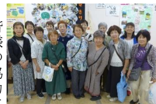
展示スペースの前で 記念写真