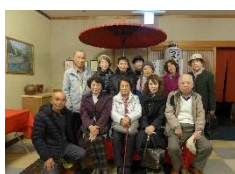
12月親睦昼食会 記念写真 つきの井にて

12月7日連絡会で連絡したように、これから新しい年度計画に入ります。皆様方の建設的・具体的なご意見と提案をお願いします。