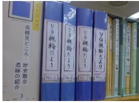
高槻図書館の本棚「VG 槻輪だより」

会報「VG 槻輪だより」は、会が開放的で、会の活動をわかり易くするため、創設と同時に発行し、令和6年1月1日に第232号を発行することが出来ました。