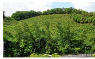
北山通りから見る「妙」送り火の山

今年の夏は、9月25日過ぎまで35℃以上の猛暑日が続き、観測史上最も暑い夏が過ぎ、やっと10月に入り秋を感じる気候になりました。 10月5日、京都地下鉄松ヶ崎駅の改札に全員集合しました。松ヶ崎駅には、初めて下車した方が多くおられました。松ヶ崎駅は、京都の北の地下鉄の駅で、地上に出ると、京都市の東西方向を結ぶ幹線道路として、最北に位置している京都「北山通り」に出ます。広い道路ですが交通量は多くなく、不