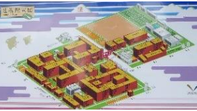
京都工芸繊維大学 松ヶ崎キャンパス 建物配置図

思議と静かで上品な町です。「北山通り」の松ヶ崎駅近辺では、京都の北山の山々が手の届くように見えます。