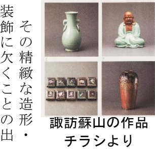
諏訪蘇山の作品 チラシより

松ヶ崎地区は、皇室との深い関係の土地で有名で、お盆の8月15・16日は「題目踊り」、8月16日は「妙法送り火の点火」が行なわれ有名です。京都工芸繊維大学松ヶ崎駅から約750mで、「京都工芸繊維大学」正門に着きました。