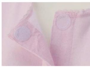
前開きの下着にマジックテープボタンがありました

手術の日が決まり、いろいろ注意事項がありました。手術当日は下着も上着も前空きのものに着ること。被るものは疵に触るので駄目。1週間は顔も洗えないお化粧も出来ないということでした。前空きのシャツなど持っていないので早速買いに走りまわりました。