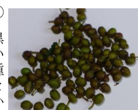
秋残つた山椒の実を全部取って乾かします

毎年春の新芽の頃には、葉をちよつと取つてきて、両手の平でパンと叩いてお吸いものやお味噌汁に入れたり、ちらし寿司の上につつたりして香りを楽しみます。 6月頃の青い実は、冷凍しておき、煮魚を作る時や佃煮を作る時に一緒に煮、重宝しています。ちりめん山椒も美味しいです。 9月。山椒の木をよく見ると取り残された実がはじめて、黒い種がついていたりしてまだ木に結構残っています。