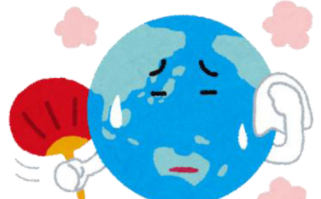
地球の温暖化は全動植物への問題です

かかりつけ医に行きました。目が見えなくて、危なくて、ようやく3日後に病院に行き、入口で症状を書いた紙を渡しました。もしもコロナだつたら迷惑をかける気が使いました。 「脱水症」との診断で、吐き気止めをもらいました。帰りはタクシーで帰りました。 毎年夏の暑さが厳しくなっています。地球温暖化のせいです。