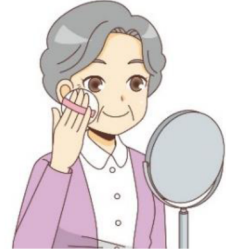
化粧は肌のためにも良いよ！！

甥から「96でもお化粧に気を使うんですね。ははは失言です。お許しを」と揶揄されてしまいました。