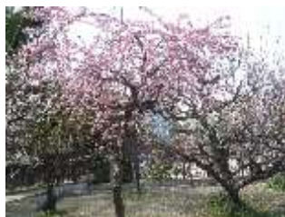
高津梅園の梅 満開

戦災を経た現代でも、 なお多くの寺院が上町台 地に集まっています。寺 院について厳密に把握で きるデータはないよう ですが、経済センサス(総務 省の調査の事業所数(仏 教系宗教)のデータを目 安にすると京都よりも上 町台地のほうがお寺が密 集したエリアだと言える ようです。