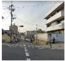
谷町8丁目交差点から西を見る

谷町筋は上町台地の高 台を縦断しており、筋の 西側の通りはやや勾配の きつい下り坂が多くなっ ていたりして、台地の上 を通っていることを実感 出来ました。