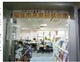
福祉用具常備展示場

次に各用具を実際に使 ったの使い方や注意点を 説明して頂きました。 見学後、みんなで近く のイタリアンレストラン で昼食をとり、大阪市中 区寺中「歴史の散歩道」へ 向かいました。