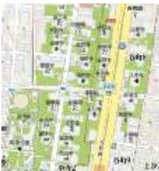
谷町筋の寺・寺・寺

高津の杜の鎮座地は、 周囲よりも一際高く、ど の方向から参拝するにも 石段を登ることになりま す。その石段は「縁切り 坂」や「縁結び坂」など と名づけられており、縁 切りや縁結びのパワース ポットとして話題になっ ています。