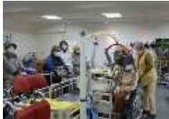
福祉用具を使い 注意点を聞く

大阪府「福祉用具常設 展示場」では、いつも相談 員が居て、福祉用具を「見 て」「触って」「試す」こと が出来、選び方・使い方等 について相談にのり説明 して頂けます。