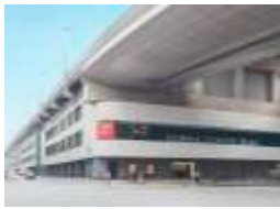
船場センタービル上に阪神高速道路

現在の橋は、本町通が市電道路として拡張された大正2年(1913)5月に架け替えられたもので、3連の鋼アーチが、ルネサンス風のデザインをもつ石造りの橋脚に支えられた重厚な構造の橋となっている。平成24年に大阪市指定文化財として指定された。