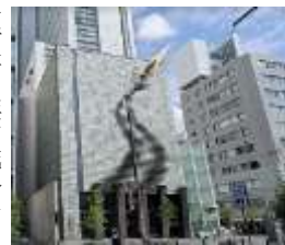
大阪産業創造館外観

大阪産業創造館 館は、本町橋の近くに有り、外壁には大阪の企業家が未来に漕ぎ出すポートをイメージしたアートモニュメントが大空に向っています。