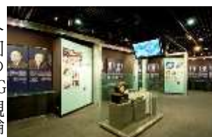
105名の企業家の展示

場のニーズを的確にとらえ、それらを事業化することで、社会・経済の発展や生活向上の原動力の役割を果たしました。ここでは、明治以降3つの時代ブロックにわけて紹介されていました。