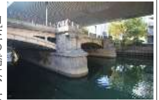
大阪市内最古の現役橋「本町橋」

本町通は、大阪市のほぼ中央を東西に走る主要地方道の愛称で、商社や卸売り問屋などが集中するオフィス街を貫く主要な通りです。 本町橋は現役の橋としては、大阪市内最古の橋です。