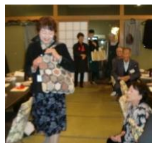
パッチワークのバック

近所の仲間3人で、わが家でパッチワークしながら、おしゃべりしながら、ティータイムを楽しみに・・・。