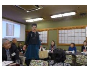
袖の左右違うツーピース 横長トートバッグも素敵

この服のリメイクは袖の左右違うのがお分かりでしょうかきつとオシャレにしたのかなと思つて頂いたら嬉しいです。それが、生地を裁つ時に間違つた結果です。しかし、これも有りかと思つて、仕上げました。帯で作つた横長トートバッグは、帯の柄の部分だけを使うと派手になるので、無地の部分をあしらいました。