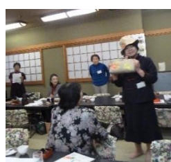
布地にプリントして 作品を作りました

世界でたった一つの花をプリントアウトしました。花のデザインをヒマワリかアサガオかハイビスカスかと色々悩みました。今年の高槻メモフェスタの時期に合わせ柄を選びました。