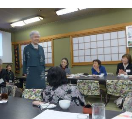
ジャンパースカートに 上着をはおり格好いい!!

永い間タンズの中で眠っていた母の着物です。何を作ろうかと、色々迷つた末ツーピースにしました。ジャンパースカートに上着を重ねて着ても、絞りの柄がバランス良く納まる様にと苦心しました。