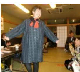
単衣のコート 今の季節に最適です

ウールの着物から柄が気に入って、単衣のコートを作ってみました。今の季節(朝・夕)の肌寒い時は、とても重宝し、着こちがよく気に入っている一枚です。赤と黒のストールも素敵でしょう。