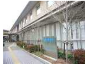
50名近くの職員が大阪府の職員で、半数近くが大阪府の職員とお聞きしました。

保健総務課： 地域保健事業の企画・立案、保健意識の啓発・高揚、医事・薬事に関すること 保健衛生課： 食品衛生、環境衛生、動物管理、衛生検査 保健予防課： 保健予防、精神保健、難病、被爆者援護、予防接種 高槻市保健所は、高槻市が中核市に移行したとい