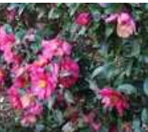
獅子頭 獅子頭は背が高く「山茶花」と間違う。