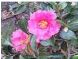
寒椿 高さ：せいせい11mくらい