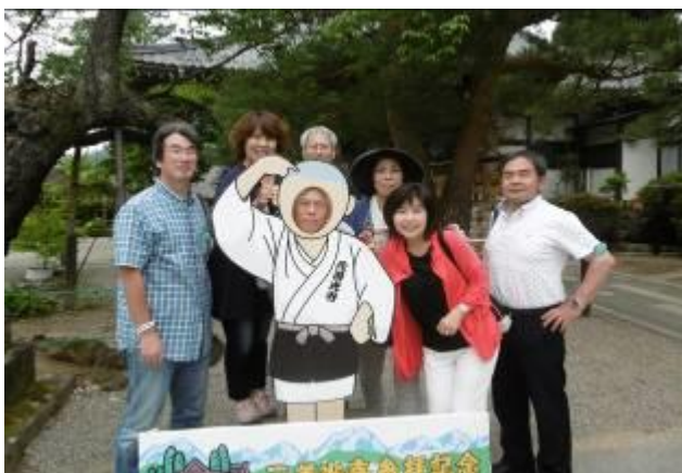
バレー仲間と（小僧さんが小生）