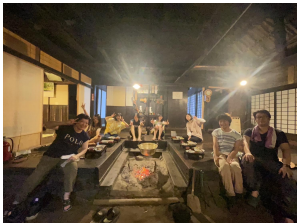
囲炉裏で集合写真