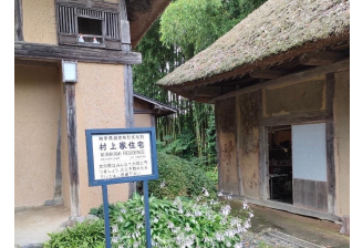
県の文化財指定の住宅