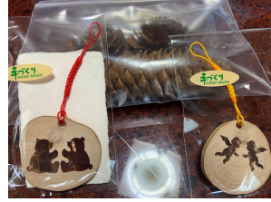
手作りさせていただいた